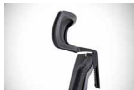
Height adjustable headrest