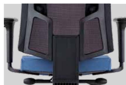
Integrated up-down mechanism