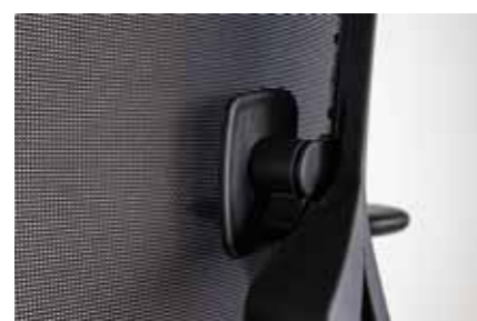
Unique lumbar support