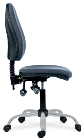
1040 MEK ERGO C ANTISTATIC (ESD) STANDARD